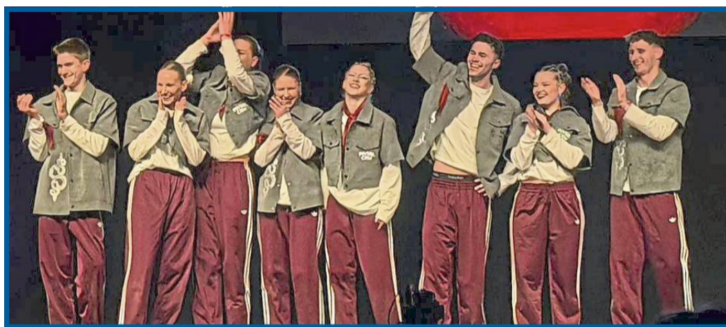
Erstmals beim Turnier zeigte die Geseker „Invisible Crew“ ihr Tanztalent.

mit deutlichem Abstand Deutscher Meister. Damit hatten sie die Qualifikation für die WM in den USA, die im Sommer stattfindet, in der Tasche.