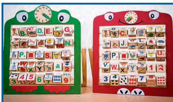
Wenn man kein Wort hat, muss man eins (er)finden: Im Sprachlabor geht's um den Einfallsreichtum der Kinder.

Willkommen im „Sprachlabor der kleinen Wortakrobaten“. Untersucht wird das Ganze im „SprachSpielLabor“. Kinder bekommen Bil-