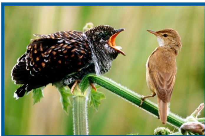
Ein Teichrohrsänger sitzt vor einem Kuckuck-Kind (l), das den Schnabel weit aufgerissen hat.

Im April kommt der Kuckuck aus Afrika, wo er über den Winter gelebt hat. Jetzt im Frühjahr ist er auf Partnersuche, weshalb er seinen typischen Gesang zum Besten gibt. Der Kuckuck ist nicht nur für seine Laute bekannt. Eine andere Sache macht ihn besonders, wodurch er bei anderen Vögeln nicht beliebt ist. Hast du bereits eine Vermutung, wovon ich spreche?