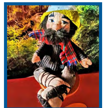
Räuber aus dem Zauberwald

Gesagt, getan. Der Zauberwald wird nun von rechts auf links gedreht und umgekehrt. Doch der Räuber vom Kleinen Volk bleibt verschwunden. Da hat Tilly-Willy plötzlich eine Idee. „Hat eigentlich jemand den Räuber aus dem Zauber-