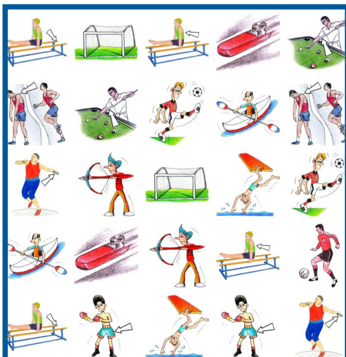
Zwillingssuche: Bis auf einen ist jeder Sportler doppelt abgebildet. Findest du den Sportler, der keinen Zwilling hat?

Der Gratis-Comic-Tag ist ein jährlich stattfindendes Ereignis, das sich an Comicfans ebenso richtet wie an alle, die diese Erzählform neu für sich entdecken möchten. In Deutschland, Österreich und der Schweiz beteiligen sich Buchhandlungen, Comicfachgeschäfte und Bibliotheken, indem sie eine Auswahl an Comics kostenfrei zur Verfügung stellen. Ziel der Aktion ist es, die Freude am Lesen zu fördern und Menschen jeden Alters für die Vielfalt und Kreativität der Comicwelt zu begeistern.