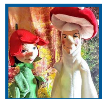
Frau Glöckchen und Herr Fliegenpilz

hüpft auf und ab und kullert dann über den Boden. Frau Glöckchen guckt fragend: „Was soll das denn bedeuten? Ich kann nichts erkennen.“ Herr Fliegenpilz macht munter weiter wie bisher. Habt ihr das Spiel erkannt?