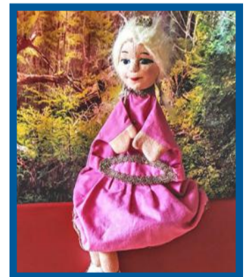
Prinzessin Bella

Nachdem Kasper alle Umarmungen und Glückwünsche entgegengenommen hat, schaut er