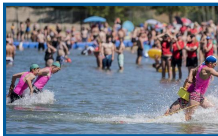
Rund 160 junge Rettungssportler werden zum Nachwuchswettbewerb am Alberssee in Lippstadt erwartet.

fen. Sonnenschutz ist auf jeden Fall angebracht. Cremt euch ein und tragt eine Kopfbedeckung. Zur Abkühlung könnt ihr auch eure Unterarme für ein paar Minuten in kühles (aber nicht eiskaltes) Wasser halten. Wichtig ist, dass ihr euch nicht zu viel in der prallen Sonne aufhaltet, vor allem zwischen 11 und 16 Uhr ist ein schattiges Plätzchen Gold wert. Oder ihr geht mal ins Museum. Dort gibt es meist Klimaanlage, die den Besuch zu einer schönen Abkühlung machen. Habt ihr auch noch Ideen? Dann schreibt uns doch eine E-Mail: kitz@derpatriot.de .