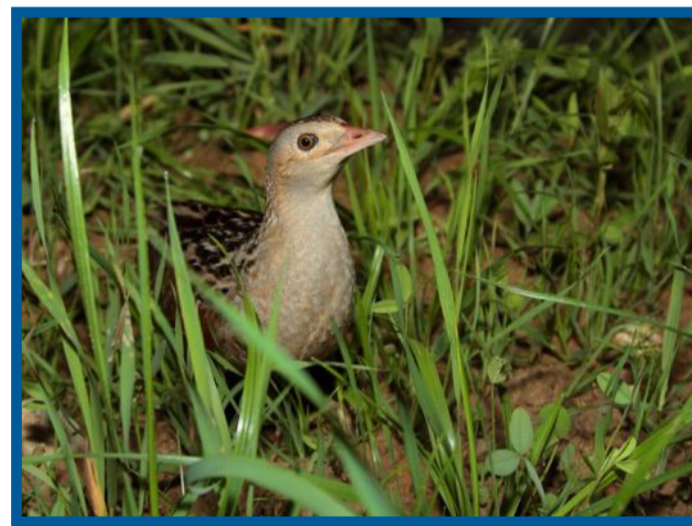
Ein Wachtelkönig sitzt auf einer grünen Wiese. Der lateinische Name „Crex Crex“ leitet sich vom Ruf des Wachtelkönigs ab.

die Leute, dass Wachteln, die aus dem Süden hochziehen, von einem Wachtelkönig angeführt werden. Das kommt daher, dass man beide Arten oft zusammen beobachten kann und sie beide in Wiesen und Felder vorkommen. So erhielt der Wachtelkönig seinen Adelstitel. Andere Namen sind Wiesenknarrer, wegen seines knarrenden Gesangs, oder Wiesenralle. Denn eigentlich ist Willi eine Ralle.