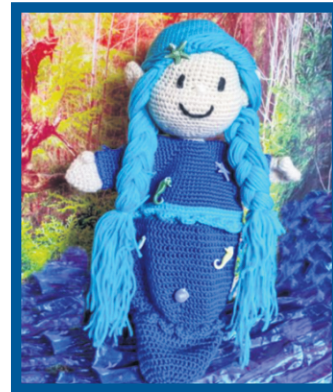
Maila

Kasper und Prinzessin Bella sind bereits unterwegs. Es ist wieder sehr warm und ein Sprung in den See ist sicher ein tolles Vergnügen. Gerade treffen sie den Riesen Mattheo. Wie ihr wisst, sind Maila und er ein Liebespaar. Über seiner Schulter trägt er ein Seil und ein Brett. Auch seine Badehose hat er dabei. Kasper ruft ihm zu: „Hallo Mattheo, was willst du mit dem Seil und dem Brett machen?“ Mattheo antwortet: „Das wird eine Überraschung.“