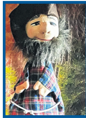
Riese Mattheo

Lippstadt – In den letzten Wochen ist es im Zauberwald ziemlich warm gewesen und Maila, die Meerjungfrau, hat heute alle zum kleinen Waldsee eingeladen. Was dort genau passiert, berichtet euch nun die Lippstädter Puppenspielerin Birgit Lux.